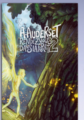
Illustration tirée du nouveau livre d'Alain Auderset RENDEZ-VOUS DANS LA FORÊT 2